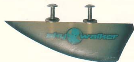
Finnenmaße Float: (L x H / cm) 13 x 4

Fußschlaufen * Die weichen Pads sind auf dem Board verklebt, konturiert und besitzen eine leichte Fußbettprägung. Die Kombination vermittelt einen hohen Komfort. Ebenfalls weich und über Klett verstellbar sind die Schlaufen, die sich etwas fummelig montieren lassen.